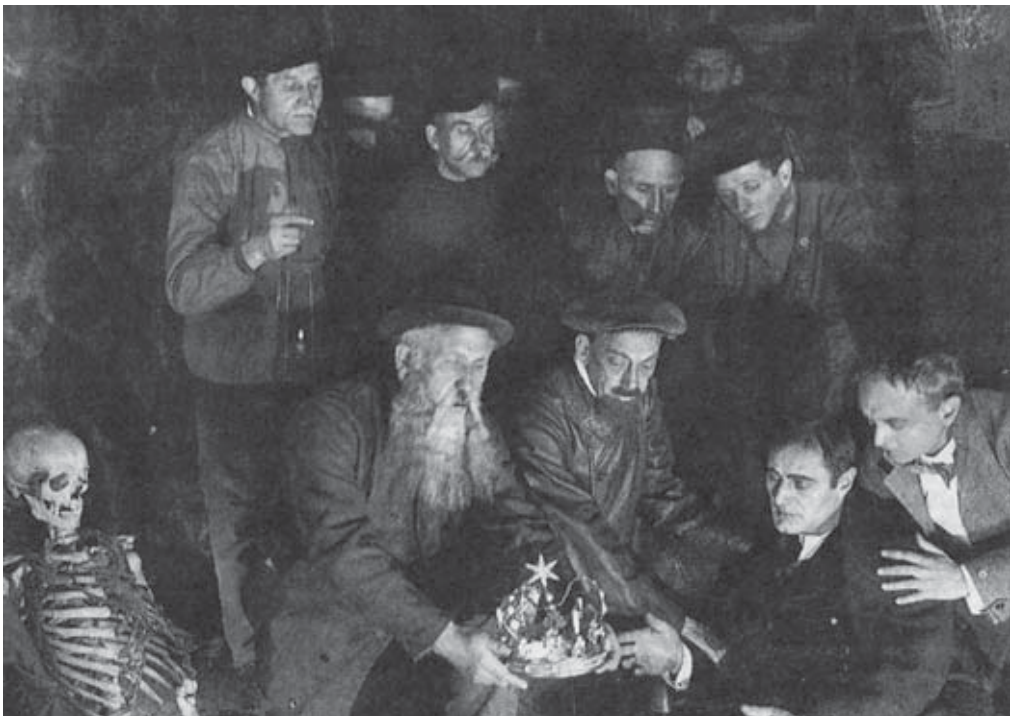
Abb. 14 „Die Krone von Palma“ war ein Detektivfilm aus der „Joe-Deebis-Serie“. Regie führte der Sensationsdarsteller Harry Piel, Produzent war Joe May.