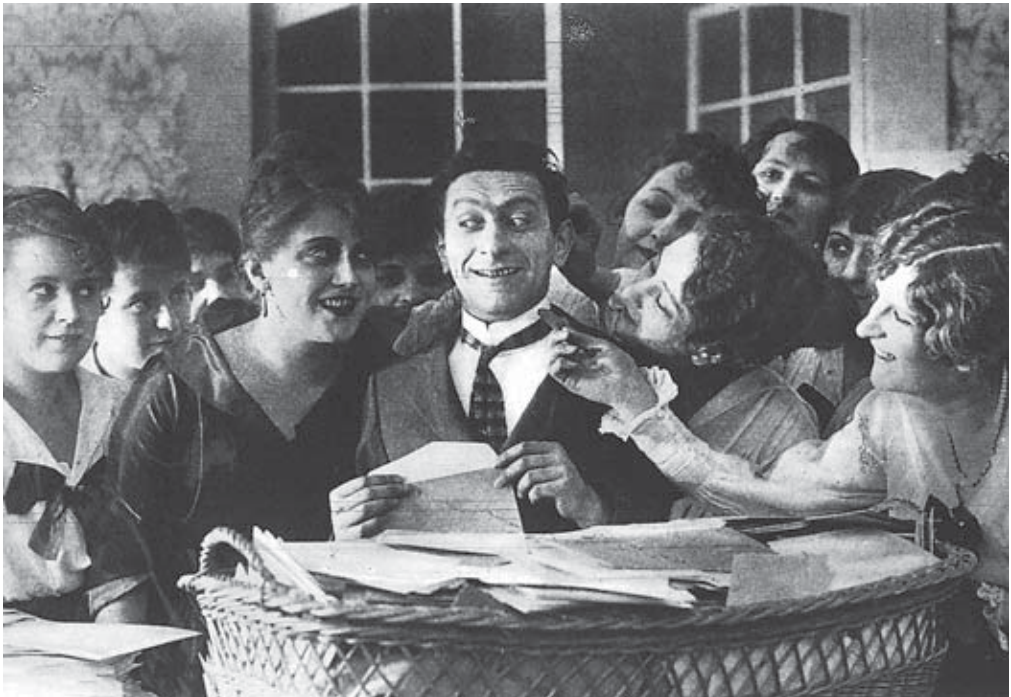
Abb. 13 Liebling der Brettener: Ernst Lubitsch, hier in „Der Blusenkönig“, begann seine Karriere als komischer Filmheld, vor dem Karrieresprung nach Hollywood.

bei seinem ersten Film (08.06.1919) in Bretten wird der Name noch nicht genannt, beim zweiten verstümmeln ihn Veranstalter, Redakteur oder Setzer zu „Lubites“ (12.07.1919), doch dann ist er schon Markenzeichen geworden: regelmäßig und in richtiger Schreibweise wird er mit dem Filmtitel genannt. In acht Filmen können die Brettener seine Regiekunst bestaunen, wobei Lubitsch einen Genrewandel vollzieht: von burlesken Komödien wie „Der Blusenkönig“ (Abb.13) hin zum monumentalen Drama „Die Augen der Mumie Ma“ mit Emil Jannings und Pola Negri, einem frühen Beispiel für das Mumien-Thema, inspiriert von den aufsehenerregenden Ausgrabungen in Ägypten. Lubitschs weibliches Pendant im komischen Fach ist Ossi Oswalda („Ossis Tagebuch“ u.a.).