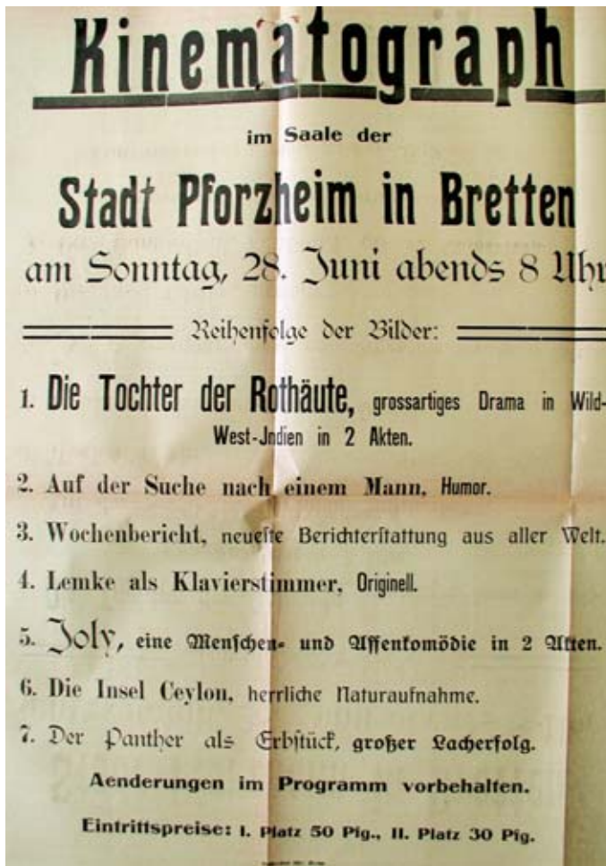
Abb. 10 Letzte Vorstellung vor dem Krieg; Filmplakat von Karl Härdt am Tag des Attentats von Sarajewo.