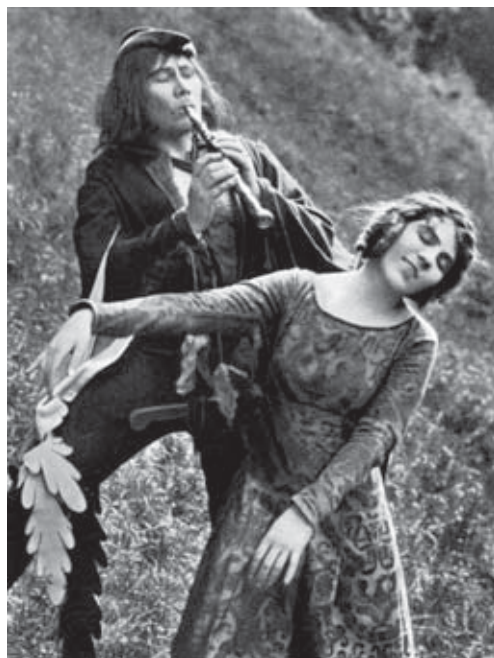
Abb. 16 Paul Wegener, hier mit Lyda Salmonowa in „Der Rattenfänger von Hameln“ war einer der Schauspieler, der das ästhetische Potential des Kinofilms erkundete.

wenige der Filme sind in Filmarchiven erhalten und gehören – solange sie noch gesehen werden – zum Erbe der reichsten und lebendigsten Epoche der deutschen Filmkultur.