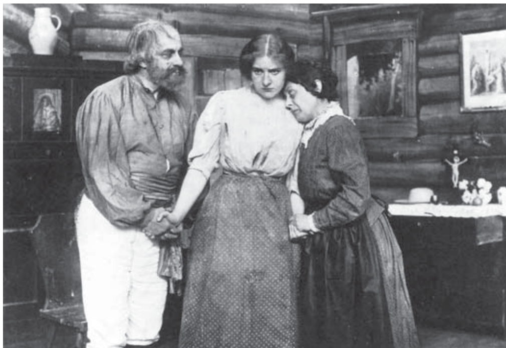
Abb. 6 Stummes Melodram: Henny Porten war 1912 dreimal in Bretten zu sehen. Sie gilt als erster Filmstar aus Deutschland.