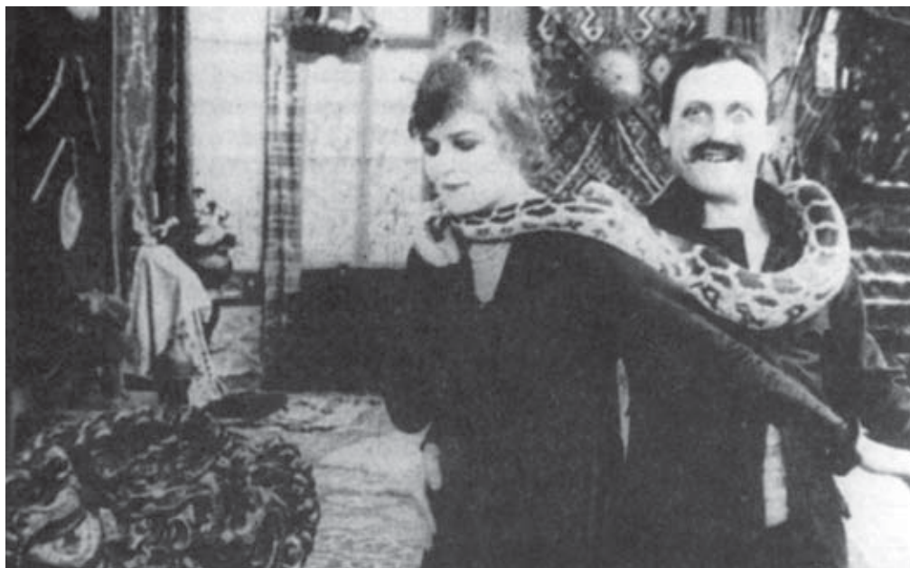
Abb. 15 Werner Krauß, Ausdruckstänzerin Anita Berber und eine eindrucksvolle Riesenschlange waren Hauptdarsteller in „Dida Ibsens Geheimnis“ von Richard Oswald.

und der Tänzerin Anita Berber in der Brettener Sonntagszeitung gibt ein prägnantes Beispiel: „eine sehenswerte psychopathologische Studie, in der ein Sadist eine Hauptrolle spielt“ (Abb.15).