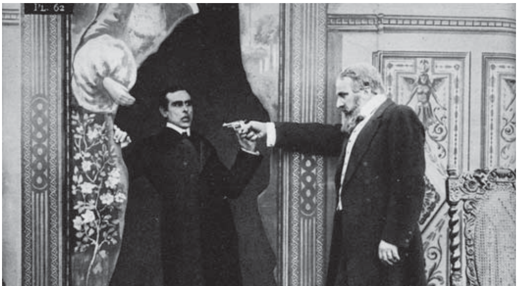
Abb. 9 Negativer Übermensch: „Dr. Gar et Hama“ war als Bösewicht ein Vorläufer von Dr. Mabuse.