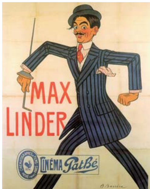
Abb. 8 Chaplins Vorbild: Max Linder war einer der ersten Stars, die namentlich auf Plakaten genannt wurden (Frankreich, um 1911).